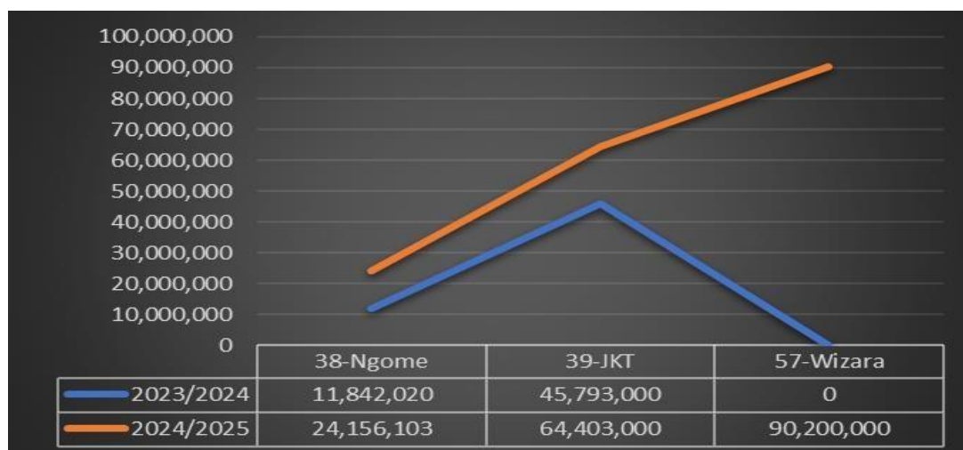
GRAFU NA 2: Ulinganisho wa Makusanyo 2023/2024 na 2024/2025